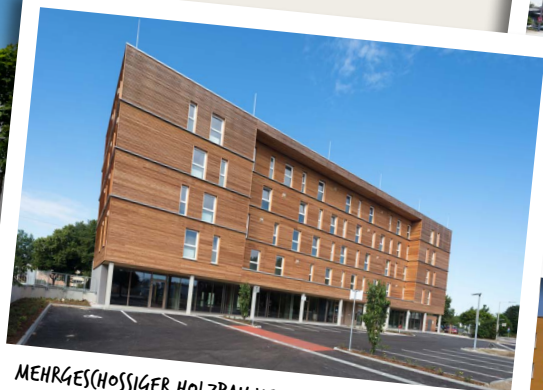
MEHRGESCHOSSIGER HOLZBAU KEHRT IN DIE STADT ZURÜCK: LIMESSTRASSE IN LEONDING