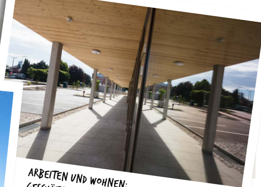
ARBEITEN UND WOHNEN: GESCHÄFTS- & GEWERBEFLÄCHEN IN LEONDING