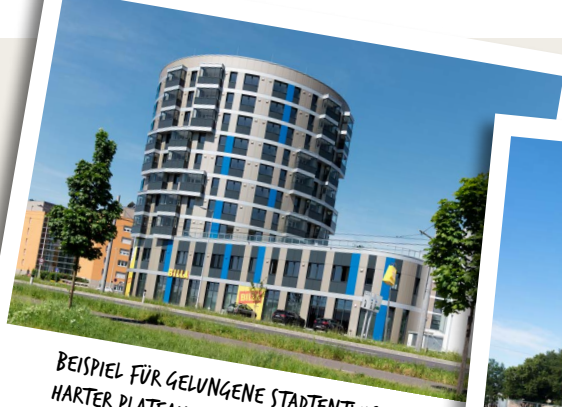
BEISPIEL FÜR GELUNGENE STADTENTWICKLUNG: HARTER PLATEAU IN LEONDING