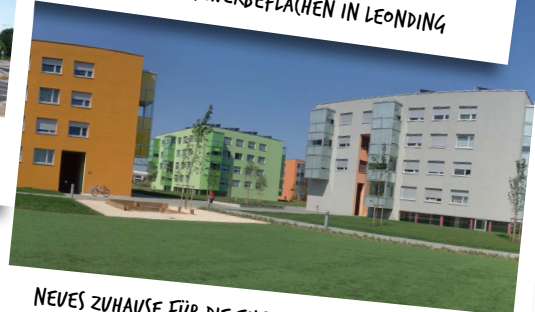
NEUES ZUHAUSE FÜR DIE EHEMALIGEN HOCHHAUS- BEWOHNER: WOHNEN IM PARK