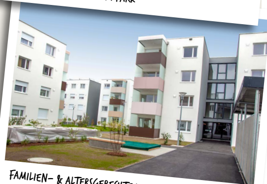
FAMILIEN- & ALTERSGERECHTE WOHNUNGEN IN EINER NEUEN WOHNIEDLUNG: STADTVILLEN IN EFERING