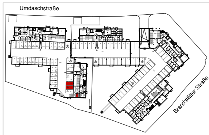
TIEFGARAGE / KELLER